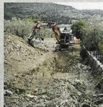
Lavori nella zona di Ascoli